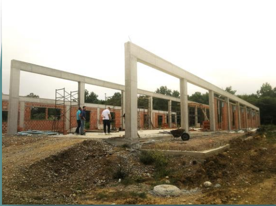
Ίδρυση οινοποιείου - αποστακτηρίου στη Μητρόπολη