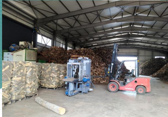
Εκσυγχρονισμός επιχείρησης δασοκομικών προϊόντων περιφερειακά της Καρδίτσας