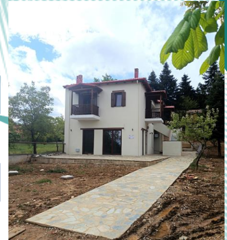
Ίδρυση τουριστικού καταλύματος με καφετέρια στη Λίμνη Πλαστήρα